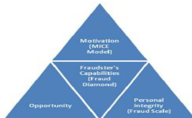
Gambar 1 The New Fraud Triangle Model

Perkembangan teori selanjutnya yaitu The New Fraud Triangle Model yang dilakukan oleh Kassem & Higson (2012) yang dalam penelitiannya bertujuan untuk memperluas pengetahuan auditor eksternal tentang fraud dan mengapa hal itu terjadi dan menjelaskan model dan tampilan segitiga Cressey secara signifikansi, menyajikan model fraud lainnya dan menghubungkannya dengan model Cressey, dan mengusulkan yang model segitiga baru fraud yang harus dimiliki oleh auditor eksternal pertimbangan saat menilai risiko kecurangan. Penelitian ini juga menunjukkan bahwa semua model kecurangan lainnya harus dianggap sebagai perpanjangan model segitiga fraud Cressey dan harus diintegrasikan dalam satu model itu termasuk motivasi, kesempatan, integritas, dan kemampuan. Model ini disebut " The New Fraud Triagle Model ".