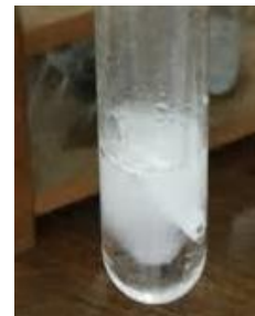
Gambar 3. Uji saponin

Indikator positif dari uji saponin ini adalah terbentuknya busa yang tetap stabil selama 8 menit pengamatan setelah dilakukan penambahan 1 tetes HCl 2N. Hasil uji saponin ini dapat dilihat pada Gambar 3.