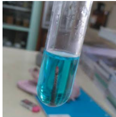
Gambar 4. Uji Steroid atau Triterpenoid

Indikator positif dari uji steroid/triterpenoid adalah dengan terbentuknya larutan berwarna merah untuk pertama kali pada reaksi positif triterpenoid dan selanjutnya terbentuknya larutan biru dan hijau untuk reaksi positif steroid. Hasil uji triterpenoid dan steroid dapat dilihat pada Gambar 4.