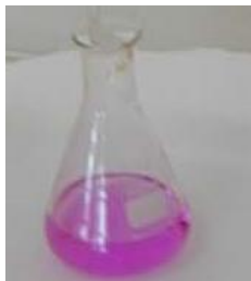
Gambar 2. Uji flavanoid

Indikator positif dari uji flavanoid adalah dengan terbentuknya warna merah muda atau ungu. Pengujian fitokimia ekstrak kasar metanol uji flavanoid mendapatkan hasil positif mengandung senyawa flavanoid. Hal ini didukung dengan pernyataan Harborne (1984) dalam Priyanto (2012), flavanoid merupakan senyawa polar yang dapat larut pada pelarut polar. Hasil uji flavanoid dapat dilihat pada Gambar 2.