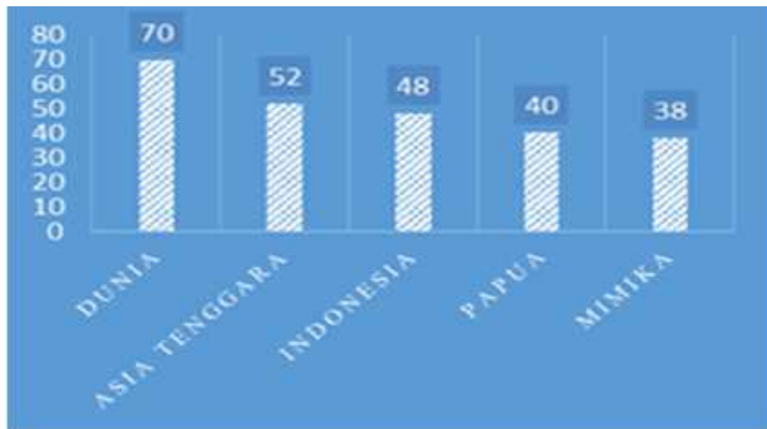
Gambar 2. Perbandingan jumlah spesies mangrove Mimika dan wilayah lain di Indonesia dan dunia