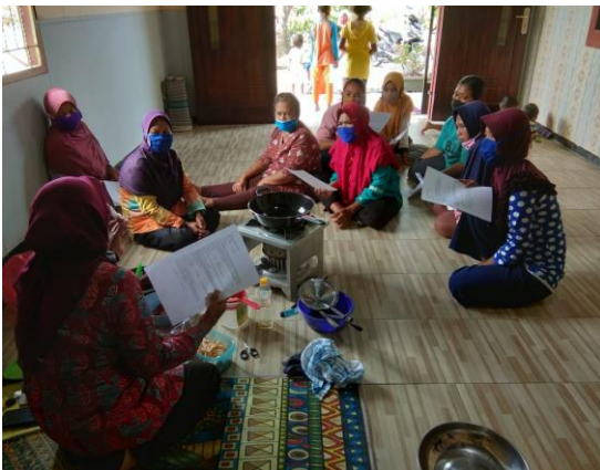
Gambar 3. Foto Persiapan Pembuatan Manisan