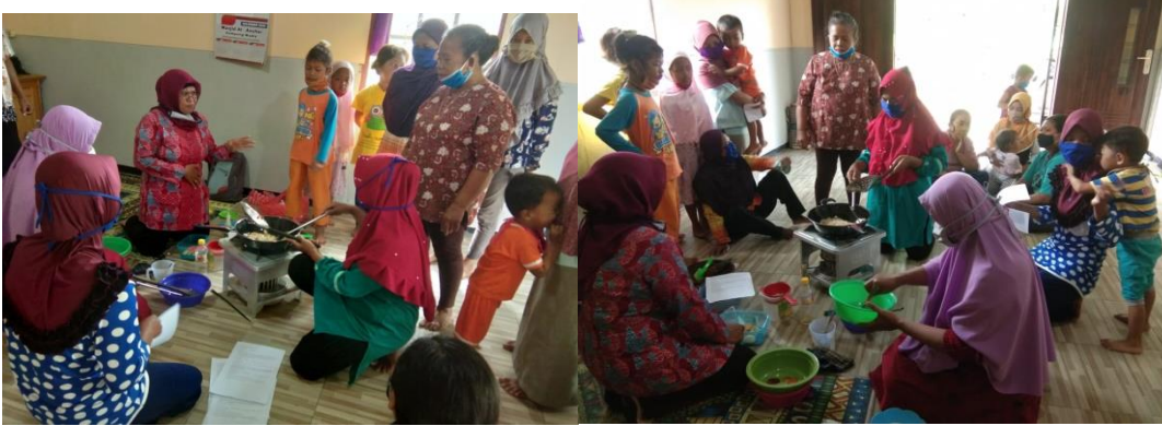
Gambar 6. Foto Pembuatan Keripik Salak