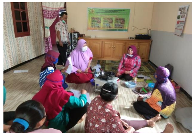
Gambar 4. Foto Penjelasan Bahan-Bahan Pembuatan Manisan Salak

Pada tahap pelaksanaan diawali dengan penjelasan dalam membuat manisan salak, manisan kering dan kripik salak, berupa bahan2 yang dibutuhkan dan cara membuat.