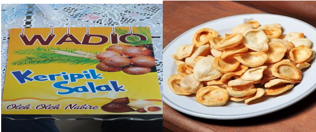
Gambar 7. Foto Kemasan dan Hasil Penggorengan Keripik Salak

Setelah kegiatan praktek dalam membuat manisan salak, manisan kering salah dan kripik salak, dilanjutkan dengan pengisian kuesioner evaluasi pelaksanaan kegiatan pengabdian kepada masyarakat.