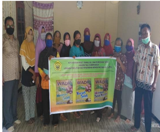
Gambar 2. Foto Bersama Peserta Pelatihan