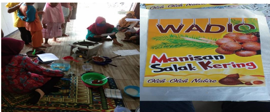
Gambar 5. Foto Pelaksanaan Pembuatan Manisan Salak dan Kemasannya