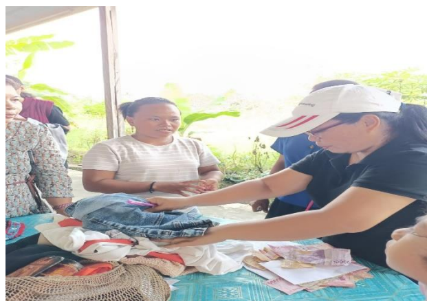
Lampiran 2. Kegiatan Pasar Murah