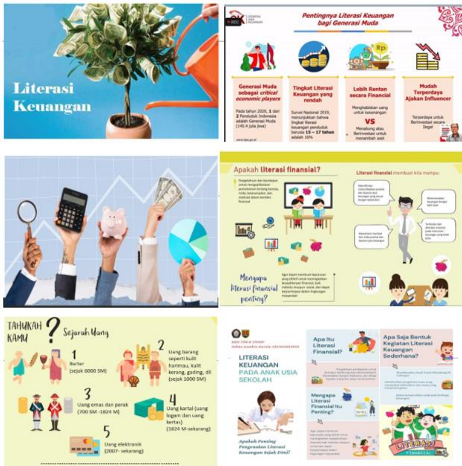
Lampiran 3. Materi Literasi Keuangan