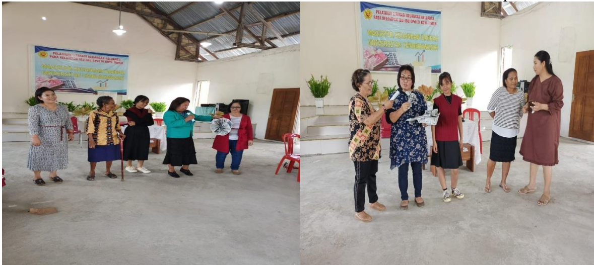
Gambar 4.5 Setiap kelompok mempresentasikan hasil karya dari koran bekas