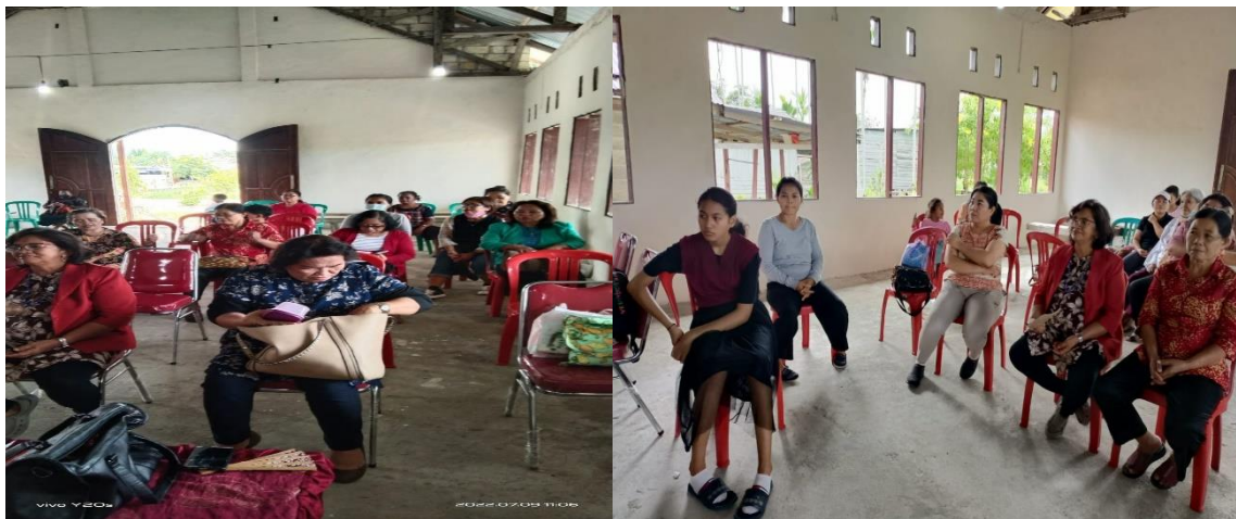
Gambar 4.1 Tahap persiapan dimana para petani mengisi daftar hadir dan pengarahan

Beberapa kegiatan pelatihan dan pendampingan Literasi Keuangan dapat digambarkan dalam bentuk dokumentasi sebagai berikut: