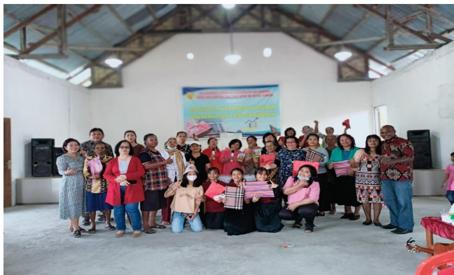
Gambar 4.6 Foto bersama setelah sesi kegiatan selesai