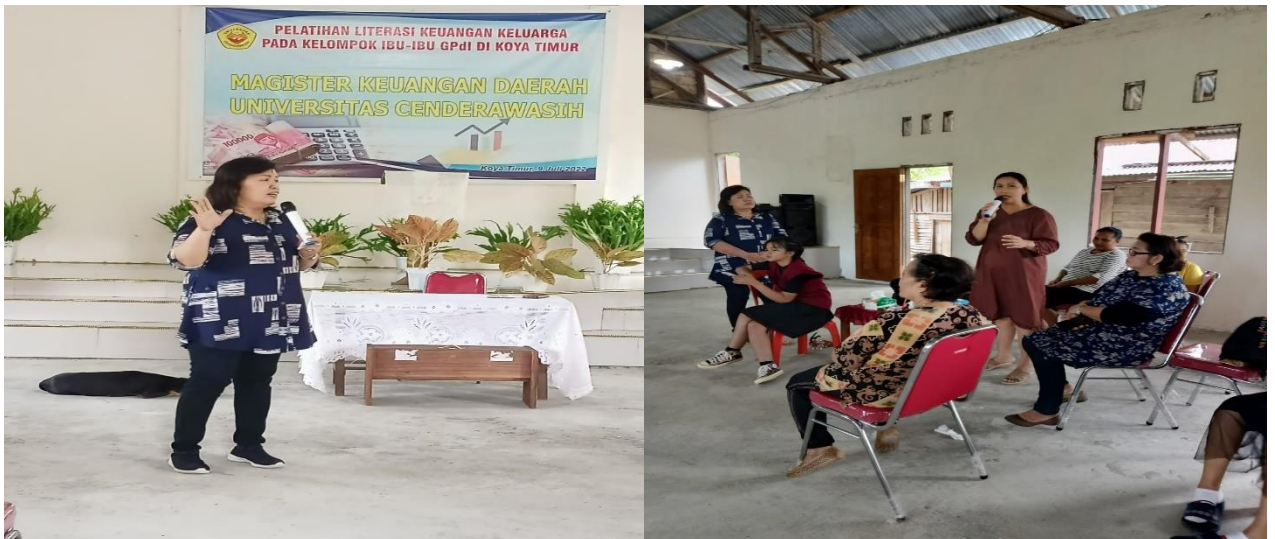
Gambar 4.3 Materi Pengelolaan Keuangan dalam Rangka Peningkatan Literasi Keuangan pada Kelompok Tani di Koya Timur