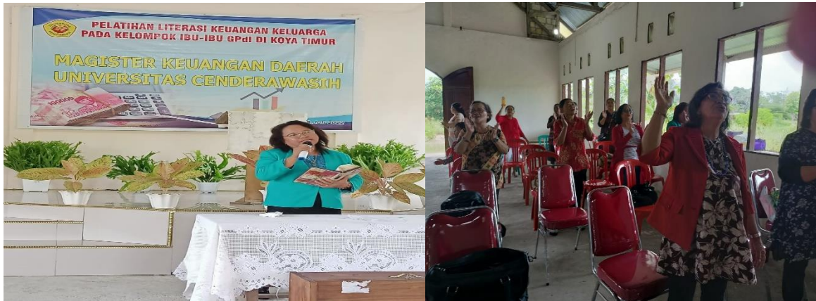
Gambar 4.2 Ibadah Bersama