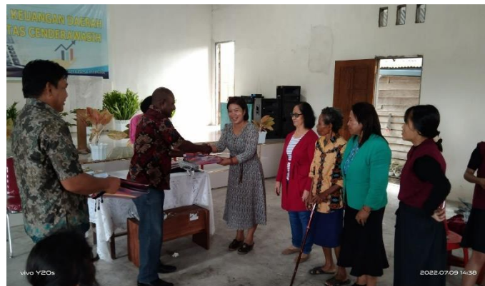
Lampiran 1. Pembagian hadiah bagi kelompok yang kreatif