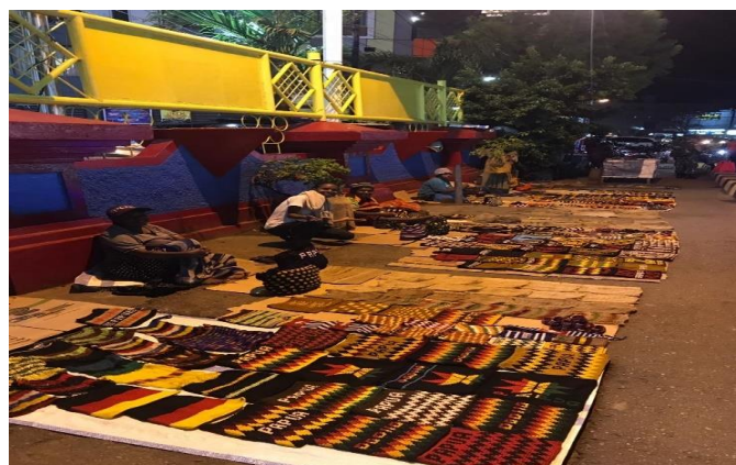
Gambar 4.5 Sharing session

Pada sharing session , kebanyakan dari mereka bercerita tentang kendala yang mereka alami terkait dengan pencatatan keuangan sederhana dari usaha yang mereka miliki. Seperti waktu berjualan mereka yang tak tentu, karena ada waktu dimana mereka tidak menjual diakibatkan kekurangan modal atau kondisi yang lain tidak memungkinkan untuk berjualan seperti sakit. Sehingga, dalam sesi tersebut beberapa dari kami memberikan masukan untuk tetap konsisten melakukan pencatatan setiap mereka berjualan saja. Adapun jika kekurangan modal, mereka bisa meminta bantuan dari pemerintah setempat atau memasuki komunitas-komunitas pengusaha noken yang bisa mendapatkan pembiayaan dari pemerintah juga.