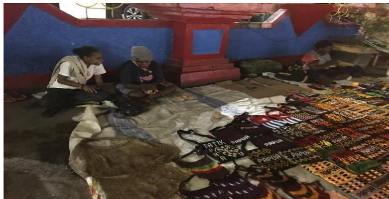
Gambar 4.4 Sharing session

Para pengusaha noken ini mulai berjualan sekitar pukul 14.00 disekitaran jalan raya Abepura. Mereka menjajakan berbagai jenis, model dan warna dari noken yang mereka buat sendiri, atau yang mereka beli dari orang lain kemudian dijual kembali. Setelah diberikan pengenalan tentang konsep keuangan sederhana, mereka kemudian mulai menyadari betapa pentingnya untuk mencatat setiap transaksi atau pengeluaran dan pemasukan yang mereka terima pada hari itu. Kurang lebih 3 jam waktu untuk memperkenalkan tentang apa itu kas masuk, kas keluar dan biaya-biaya yang dikeluarkan selama proses pembuatan noken sampai dengan noken tersebut terjual. Setelah itu, dilanjutkan dengan sharing session .