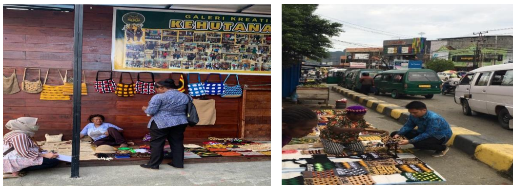
Gambar 4.3 Pengenalan Konsep Keuangan Sederhana