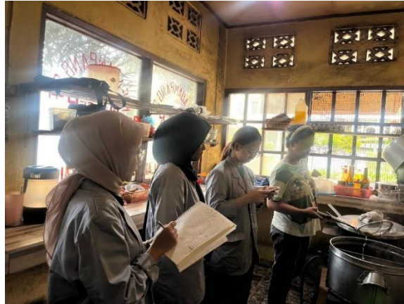
Gambar 1. Penyampaian materi sederhana mengenai harga pokok produksi

Pada tanggal 29 April 2024, pengabdian melaksanakan kegiatan pengabdian. Pada saat itu, pengabdian pergi ke tempat usaha “Mie Medan”. Disana, pengabdian menyampaikan materi dasar terlebih dahulu terkait dengan pencatatan sederhana seperti pemasukan dan pengeluaran serta identifikasi biaya untuk menyusun harga pokok produksi.