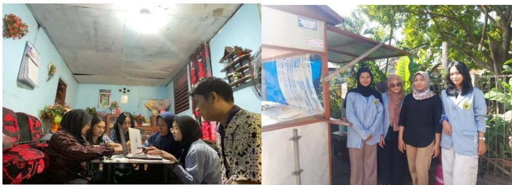
Gambar 5. Proses pendampingan dan evaluasi pada masing-masing pelaku usaha

Dalam tahap ini ditemukan sedikit kendala terkait perhitungannya karena pelaku usaha tidak terbiasa mengidentifikasi biaya dan menghitung seluruh biaya produksi dan seringkali lupa menghitung seluruh pengeluaran dalam proses produksi. Oleh sebab itu, pengabdian menekankan untuk pentingnya melakukan pencatatan secara berkala sehingga komponen dalam proses produksi bisa terekam dengan baik. Secara keseluruhan, hasil evaluasi menunjukkan progres yang baik sesuai tujuan kegiatan pengabdian ini,