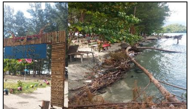
Gambar 4. Kondisi Pantai Cibery yang mengalami Abrasi

Sekitar awal tahun 2018 ke bawah kondisi fisik lokasi penelitian mengalami abrasi pantai yang diakibatkan oleh gelombang laut dan arus seperti Pantai Cibery dapat dilihat pada Gambar 4.9.