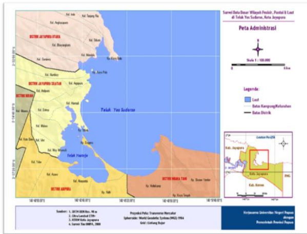
Gambar 2. Denah Lokasi Penelitian

Metode penelitian yang digunakan adalah deskriptif kualitatif. Sugiyono (2009) menjelaskan bahwa fungsi metode adalah memberikan deskripsi atau penggambaran objek penelitian menggunakan data atau sampel yang telah dikumpulkan seperti adanya, tanpa memberikan kesimpulan umum. Sehingga penelitian ini berusaha menggambarkan data sebagaimana adanya menyangkut situasi subjek ataupun fenomena yang dikumpulkan dalam sebuah populasi. Data diperoleh secara deskriptif melalui studi literatur.