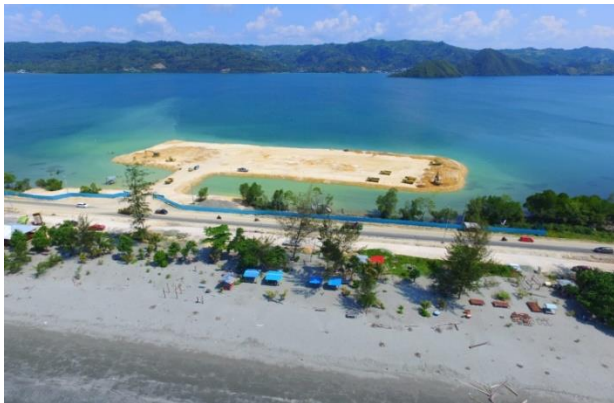
Gambar 1. Lokasi reklamasi di Teluk Youtefa Tobati-Injros, untuk Urena Olahraga Venue Dayung (PON 2021)

Papua. Kota Jayapura adalah Ibu Kota Provinsi Papua yang akan dijadikan sebagai salah satu tempat pelaksanaan PON 2020 di Provinsi Papua, sehingga beberapa sarana olahraga di bangun di kota jayapura salah satunya adalah sarana Venue Dayung yang di bangun di Teluk Youtefa Kota Jayapura, arena ini dapat digunakan untuk cabang olahraga dayung, layar, renang perairan terbuka dan selam.