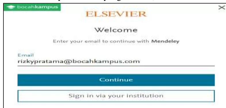
Gambar 3. Cara Memasukkan Email

Masukkan Email kamu pada kolom yang tersedia, kemudian klik Continue