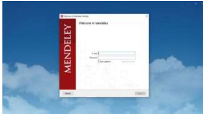
Gambar 5. Cara Melanjutkan Registrasi

Setelah masuk ke dalam aplikasi, tutup Ms. Word. Jika MS Word masih terbuka maka akan muncul jendela permintaan untuk menutup MS Word.