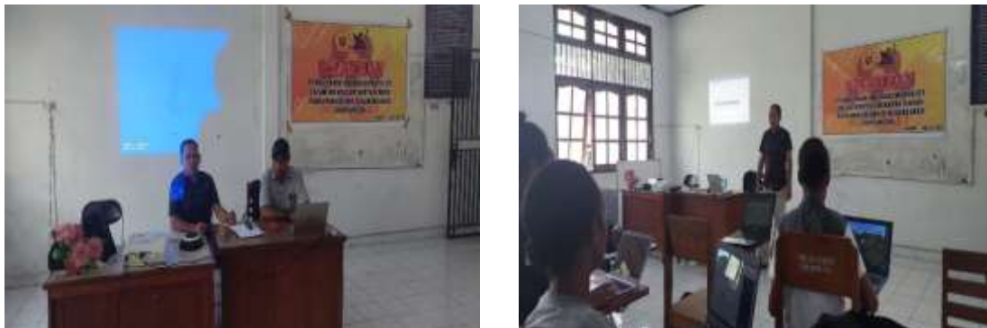
Gambar 8. Menjelaskan Materi

juga diberikan pengetahuan tentang etika publikasi ilmiah dan plagiarisme. Plagiarisme merupakan kegiatan menggunakan ide/gagasan/tulisan orang lain tanpa menuliskan sumber/orang yang menciptakan gagasan/ide/tulisan tersebut. Oleh karena itu, salah satu cara untuk mencegah plagiarisme adalah dengan menuliskan sumber/nama penulis dari tulisan yang dikutip baik secara sebagian atau keseluruhan pada daftar pustaka. Penggunaan aplikasi Mendeley dalam hal ini akan sangat membantu peserta yang masih berstatus sebagai mahasiswa dalam mengerjakan tugas-tugas kuliah dan atau laporan akhir/skripsi.