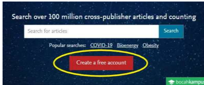
Gambar 2. Cara Mendaftarkan Akun

Masukkan Email kamu pada kolom yang tersedia, kemudian klik Continue