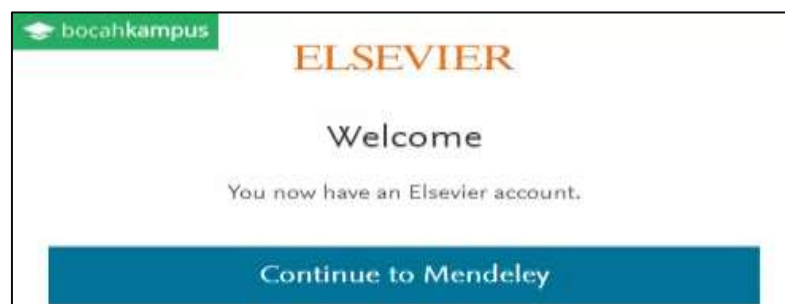
Gambar 4. Cara Melanjutkan Registrasi

Buka aplikasi Mendeley, pilih Register untuk membuka akun baru atau isi data email dan password akun yang ada untuk Login