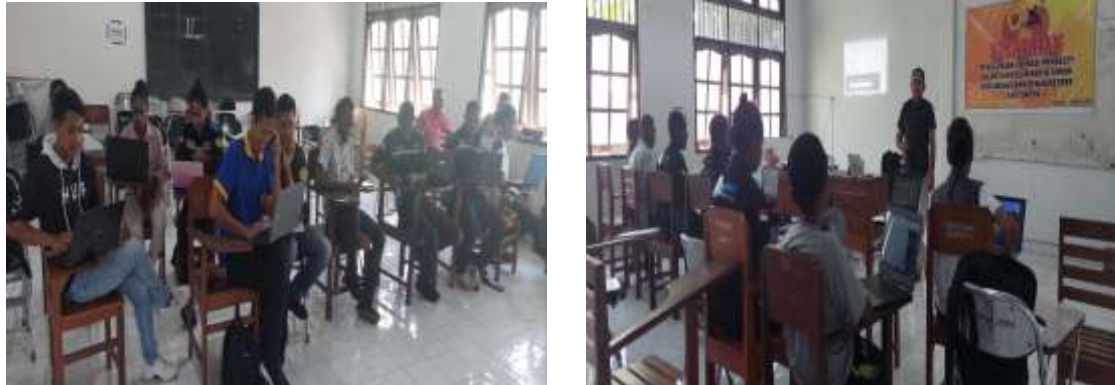
Gambar 9. Praktek Peserta