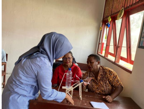
Gambar 3. Guru Menjelaskan Hasil Karya (berdiskusi)

Kegiatan pengabdian ini mampu meningkatkan pemahaman dan keterampilan guru dalam pembuatan alat peraga IPA dari barang sederhana/bekas, mengingat di sekolah tersebut tidak tersedia KIT IPA. Pengabdian ini juga mampu meningkatkan pemahaman konsep, hasil belajar dan motivasi peserta didik karena para peserta didik lebih memudahkan memahami konsep materi IPA yang dijelaskan oleh guru dengan menggunakan alat peraga sederhana. Selain itu, kegiatan pengabdian ini mampu menjadikan suasana kelas menjadi lebih interaktif dan menyenangkan karena melibatkan secara langsung peserta didik dalam pembelajaran (guru dan peserta didik bersama-sama membuat alat peraga sederhana), terjadi diskusi dengan guru dan peserta didik serta proses pembelajaran tidak monoton hanya berpusat pada guru.