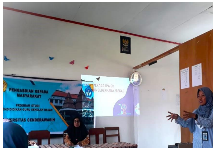
Gambar 1. Tim Pengabdian Memberikan Materi

Pada tahap persiapan Tahap Persiapan yang dilakukan adalah: (1) menyiapkan segala administrasi yang diperlukan, (2) mengkoordinasikan dengan mitra/masyarakat yang menjadi target pengabdian, (3) mengobservasi kelengkapan sarana dan prasarana di lokasi kegiatan pengabdian, (4) menyiapkan materi pelatihan, alat dan bahan habis pakai yang akan digunakan, (6) menyediakan barang bekas layak pakai sebagai bahan utama dalam pembuatan media pembelajaran, (7) menyusun jadwal kegiatan pelatihan.