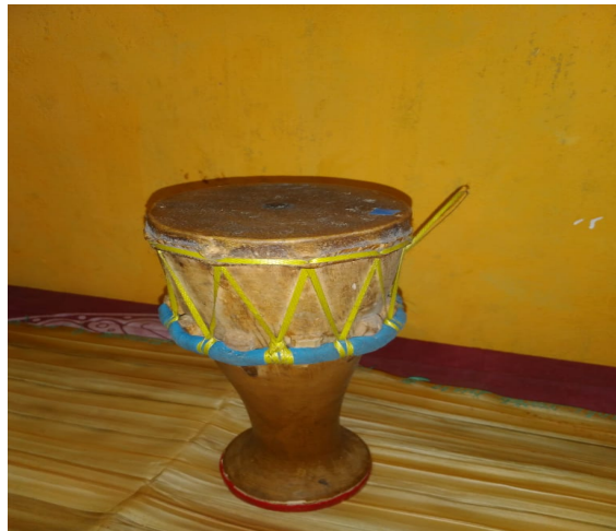
Gambar 4.3 Tifa ( tummour )