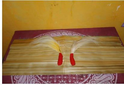
Gambar 4.6 Bulu burung cenderawasih ( hak ma )