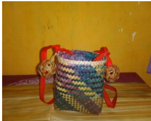
Gambar 4.9 Tomang ( hinyer tini )

Antribut-atribut yang digunakan laki-laki di dalam tarian tummour dapat dilihat pada gambar-gambar dibawah ini.