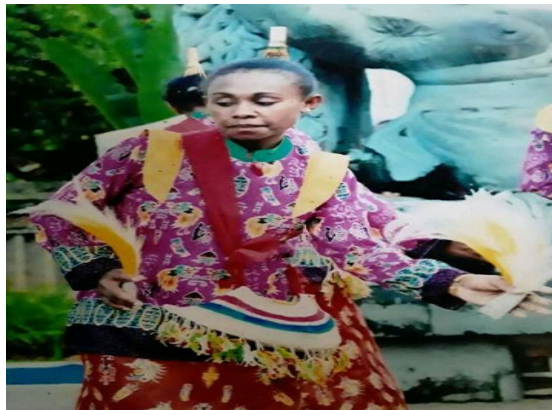
Gambar 4.4 Atribut yang digunakan wanita di dalam tarian tummour