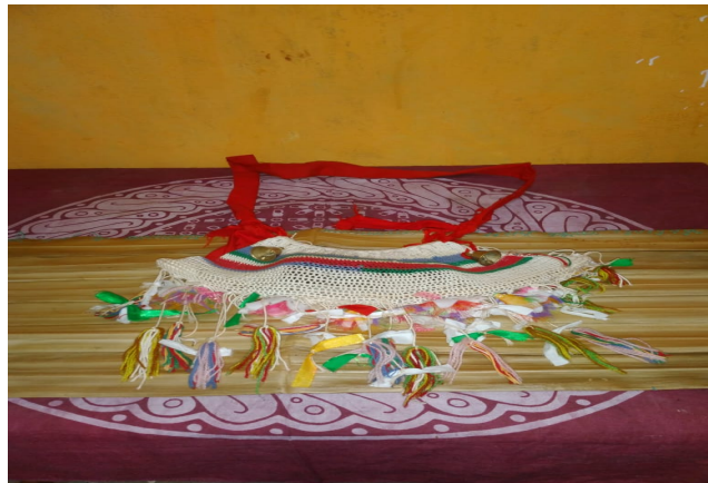
Gambar 4.5 Tas ( ka'bari )

Menurut informasi yang diceritakan oleh Bapak Albert Hindom bahwa selain pakaian yang digunakan di dalam tarian tummour atribut-atribut lainnya yang digunakan yaitu bulu burung cenderawasih yang diikat bagian bawahnya menggunakan tali berwarna merah.