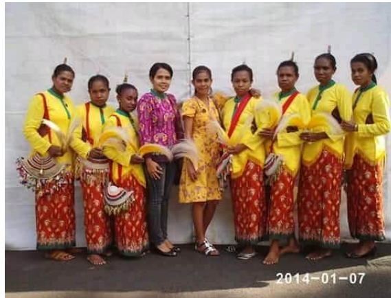
Gambar 4.12 Atribut-atribut