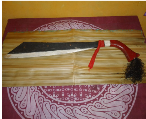
Gambar 4.10 Parang ( hoondti )