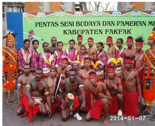
Gambar 4.11 Atribut-atribut