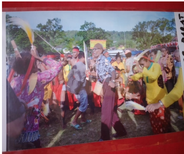
Gambar 2 Festival Budaya di Manokwari