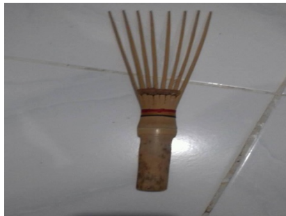
Gambar 4.7 Sisir bambu ( huwer )