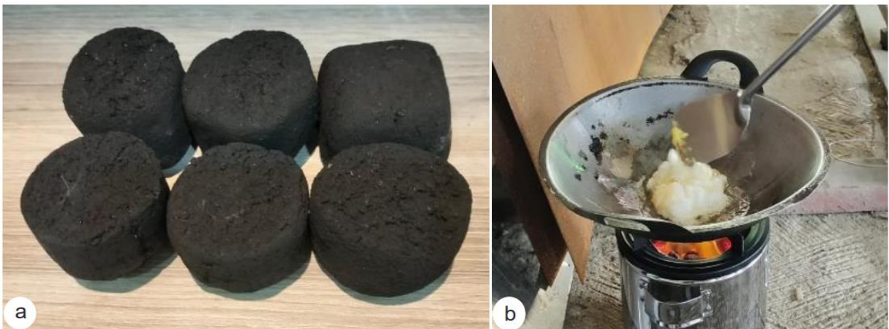
Gambar 2. Produk briket arang. a. briket hasil penelitian, b. pemanfaatan briket.