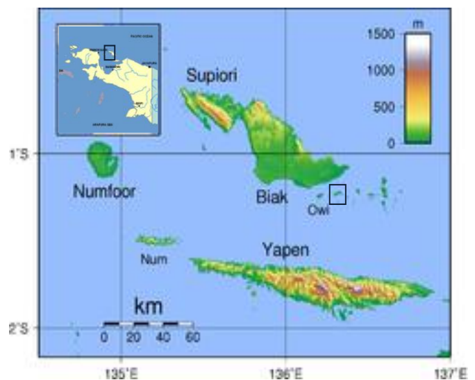
Gambar 1. Lokasi penelitian.

Penelitian ini dilaksanakan selama enam bulan dari bulan Januari hingga bulan Juni 2010. Pengambilan data dilakukan di Perairan Pulau Auki Distrik Padaido Kabupaten Biak Numfor (gambar 1), di Papua.