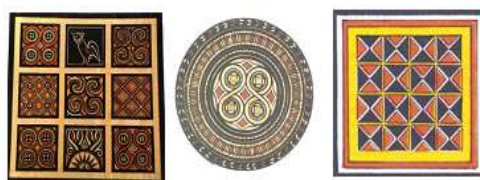
Gambar 2.6 Ukiran pada Rumah Adat Tongkonan

Demikian juga ukiran rumah adat tongkonan terdapat bangun-bangun geometri seperti lingkaran, segitiga, persegi, belahketupat, persegipanjang dengan gambar yang simetris dan terdapat diagonal serta sudut siku-siku.