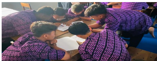
Gambar 1 Pembelajaran PBL tahap orientasi pada masalah

Berdasarkan proses pembelajaran model Problem Based Learning (PBL) berbantuan Software GeoGebra terlihat bahwa kemampuan pemecahan masalah matematis efektif karena pada proses pembelajaran PBL terdapat kegiatan orientasi siswa pada masalah, mengorganisasi siswa untuk belajar, membimbing penyelidikan individual dan kelompok, mengembangkan dan menyajikan hasil karya, menganalisis dan mengevaluasi proses pemecahan masalah yang dapat menjadi salah satu faktor yang menjadikan kemampuan pemecahan masalah matematis siswa lebih baik.