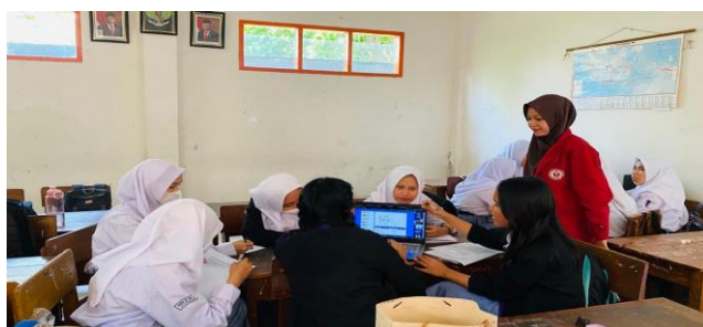
Gambar 3 Pembelajaran PBL tahap membimbing penyelidikan individual dan kelompok

Kemudian pada tahap mengorganisasi siswa untuk belajar, siswa dibagi menjadi beberapa kelompok yang terdiri dari 5-6 orang. Pada tahap ini siswa mengidentifikasi operasi yang terlibat serta membuat rencana pemecahan masalah dan strategi yang diperlukan untuk menyelesaikan masalah yang ada di LKPD. Baik menyusun rencana tertulis maupun dengan Software GeoGebra .