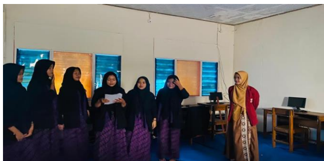
Gambar 4 Pembelajaran PBL tahap mengembangkan dan menyajikan hasil karya

Setelah itu tahap membimbing penyelidikan individual dan kelompok, siswa perlu mengartikan informasi yang diberikan kedalam bentuk matematika dan melaksanakan strategi atau rencana pemecahan masalah yang telah dibuat. Permasalahan yang diberikan dapat menciptakan ide-ide kreativitas baru sehingga siswa menumbuhkan kreativitas yang ada dalam dirinya dan akan dipresentasikan sebagai bahan evaluasi proses dan hasil belajar siswa. Dengan siswa membuat kreativitas baru siswa menjadi terlihat lebih memahami materi yang berkaitan dengan kemampuan pemecahan masalah matematis baik dengan tertulis ataupun dengan Software GeoGebra dan siswa lebih bersemangat dalam membuat sebuah karya Bersama dengan teman-teman kelompoknya.