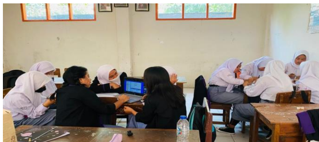
Gambar 2 Pembelajaran PBL tahap mengorganisasi siswa untuk belajar

Kemudian pada tahap mengorganisasi siswa untuk belajar, siswa dibagi menjadi beberapa kelompok yang terdiri dari 5-6 orang. Pada tahap ini siswa mengidentifikasi operasi yang terlibat serta membuat rencana pemecahan masalah dan strategi yang diperlukan untuk menyelesaikan masalah yang ada di LKPD. Baik menyusun rencana tertulis maupun dengan Software GeoGebra .