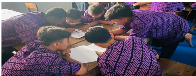
Gambar 1 Pembelajaran PBL tahap orientasi pada masalah

Berdasarkan proses pembelajaran model Problem Based Learning (PBL) berbantuan Software GeoGebra terlihat bahwa kemampuan pemecahan masalah matematis efektif karena pada proses pembelajaran PBL terdapat kegiatan orientasi siswa pada masalah, mengorganisasi siswa untuk belajar, membimbing penyelidikan individual dan kelompok, mengembangkan dan menyajikan hasil karya, menganalisis dan mengevaluasi proses pemecahan masalah yang dapat menjadi salah satu faktor yang menjadikan kemampuan pemecahan masalah matematis siswa lebih baik.