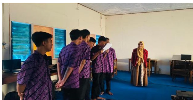
Gambar 8 Kegiatan Pembelajaran PBL

kecakapan dari pada pengetahuan yang dihafal. Dalam pembelajaran PBL siswa dapat mentransfer pengetahuannya untuk memahami masalah dunia nyata, mengutarakan dan menjelaskan masalah dalam kehidupan sehari-hari ke dalam pembelajaran, sehingga dapat menumbuhkan rasa senang dalam belajar.