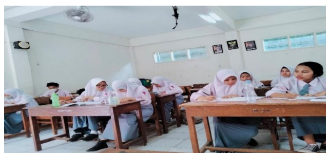
Gambar 6 Pembelajaran Konvensional

Tahapan yang terakhir yaitu menganalisis dan mengevaluasi proses pemecahan masalah. Pada tahap ini siswa melakukan refleksi, resume dan membuat kesimpulan secara lengkap, komprehensif dari materi yang telah dipelajari.