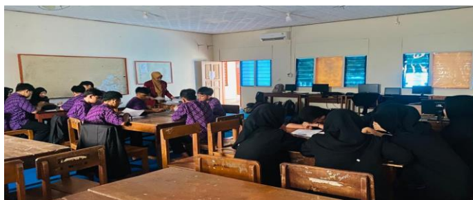
Gambar 5 Pembelajaran PBL tahap menganalisis dan mengevaluasi proses pemecahan masalah

LKPD maupun di Software GeoGebra . Siswa lainya dapat bertanya jika ada yang masih tidak dimengerti dan guru akan ikut menjelaskan jika ada pertanyaan yang tidak terjawab. Dengan begitu, siswa dapat saling berbagi informasi dan dapat lebih memahami bagaimana cara memecahkan masalah.