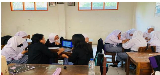
Gambar 7 Kegiatan Pembelajaran PBL

Dalam kegiatan pembelajaran PBL pada gambar 7, siswa dituntut untuk lebih banyak mendapatkan