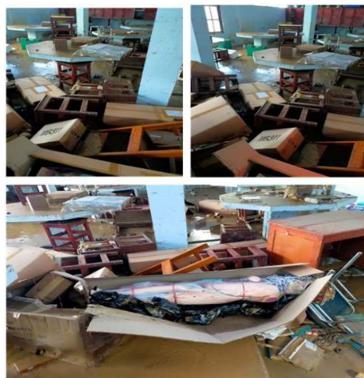
Gambar 1. Keadaan Labotatorium IPA SMA 4 Jayapura.

lumpur dengan kedalaman lebih dari 1 meter (Gambar 1).