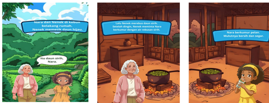
Gambar 5. Sampel ilustrasi dari “Daun Sirih dari Kebun Nenek”.