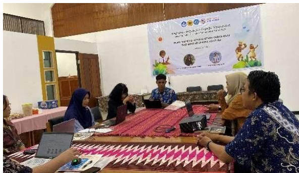
Gambar 1. Suasana kegiatan pelatihan

Hasil yang dicapai melalui kegiatan pengabdian “Pelatihan Pembuatan Ilustrasi Cerita Anak bagi Guru-guru SD di Kota Jayapura” adalah sebagai berikut. Para peserta pelatihan (guru SD) menghasilkan ilustrasi untuk tiga cerita (Tabel 1).