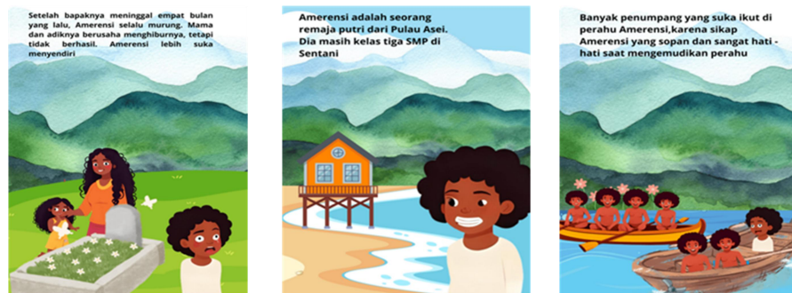
Gambar 4. Sampel ilustrasi dari buku “Perahu Amerensi”