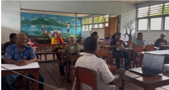
Gambar 3. Kegiatan pelatihan pengembangan bahan ajar berdasarkan kearifan lokal

yang kolaboratif dan berbasis lokalitas ini menjadikan bahan ajar bukan hanya sarana pembelajaran kontekstual, tetapi juga instrumen strategis dalam mempertahankan nilai-nilai budaya di lingkungan masyarakat adat. Gambar 3, menampilkan kegiatan pelatihan pengembangan bahan ajar berdasarkan kearifan lokal, melibatkan guru-guru dari SD YPK Ifar Babrongko.