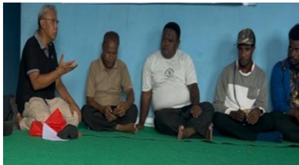
Gambar 1. Kegiatan koordinasi dengan pemimpin masyarakat dan pihak sekolah selama tahap eksplorasi dan perencanaan kolaborasi.

Proses inventarisasi ini sekaligus merupakan tahap integrasi epistemologis antara pengetahuan lokal dan pendidikan formal. Hal ini sejalan dengan gagasan Orosco (2014) dan Madalina & Tanase (2020) yang menekankan bahwa pembelajaran tidak dapat dilepaskan dari konteks sosial dan budaya peserta didik. Pendekatan serupa juga diterapkan oleh Ali dkk. (2025) dalam kajian sistematis tentang pembelajaran berbasis etnosience di sekolah dasar, yang menunjukkan bahwa integrasi pengetahuan lokal meningkatkan keterlibatan dan relevansi belajar siswa. Gambar 1 memperlihatkan Kunjungan awal ke SD YPK Ifar Babrongko dan diskusi koordinasi dengan pemimpin masyarakat dan pihak sekolah selama tahap eksplorasi dan perencanaan kolaborasi.