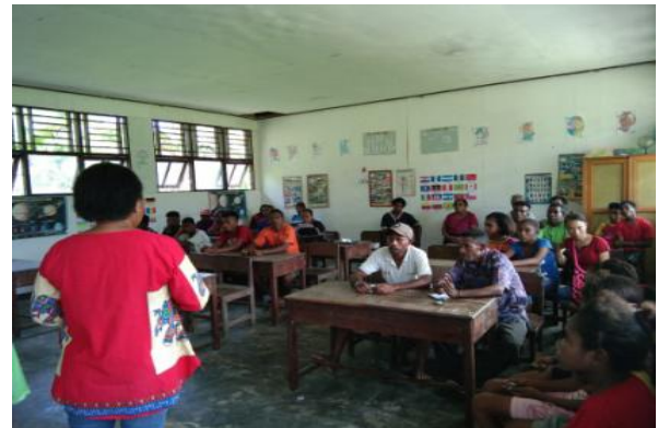
Gambar 1. Partisipasi Masyarakat Barawai dalam kegiatan PKM

PLH sebagai salah satu upaya konservasi dengan peran dan partisipasi masyarakat, terutama generasi muda untuk menimbulkan kesadaran dalam mengkonservasi Cenderawasih Kuning Kecil dan Habitatnya merupakan suatu bentuk interaksi sosial yang menjadi perhatian dalam kajian sosiologi dan beberapa disiplin ilmu lainnya. Peran atau partisipasi menuntut adanya keikutsertaan seseorang atau kelompok dalam suatu kegiatan. Keikutsertaan atau keterlibatannya seseorang dapat secara langsung dan tidak langsung. Keterlibatan secara langsung, misalnya ikut serta langsung melaksanakan suatu kegiatan (terlibat secara fisik); sedangkan keterlibatan secara tidak langsung, misalnya seseorang secara fisik tidak ikut terlibat dalam suatu kegiatan tetapi memberikan bantuan material atau sumbangan pikiran dalam kegiatan tersebut (Akhyar 1994 dan Simatupang 2000).