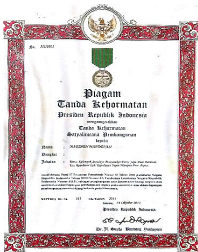
Gambar 2. Piagam Satya Lencana

Kerja keras dan semangat kelompok Dorey Jaya dalam melestarikan Cenderawasih dan habitatnya membuahkan hasil yang luar biasa yaitu dengan memperoleh penghargaan Satyalancana Pembangunan oleh Preseiden RI Bapak Susilo Bambang Yudoyono pada tahun 2011.