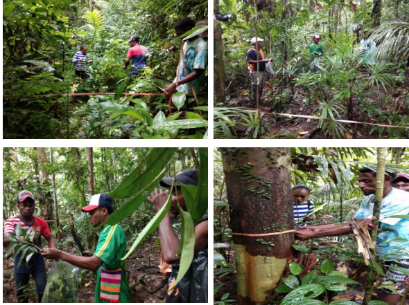
Gambar 7. Aktifitas lapangan dalam penerapan metode analisis vegetasi

plementasi materi tersebut dipraktekan langsung di lapangan tentang bagaimana menganalisis bentuk dan struktur vegetasi, menghitung populasi Cenderawasih dan merekayasa habitat bagi keberlangsungannya dan kenyamanan satwa dalam meletakkan sarang untuk kepentingan konservasi agar satwa ini tetap lestari.