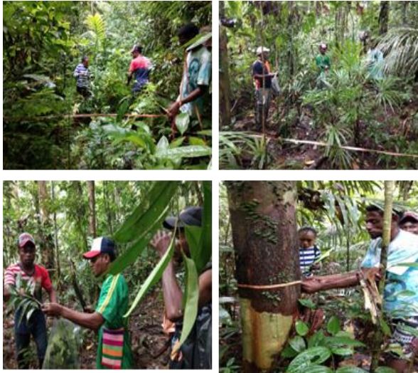
Gambar 4. Kegiatan di lapangan

antusias ketika kegiatan lapangan dilakukan. Mereka masing-masing berusaha untuk memperoleh pengetahuan sebanyak mungkin tentang cara menghitung populasi tumbuhan di hutan, bagaimana cara membuat petak plot pengamatan dan bagaimana cara mengukur diameter batang dan hal penting lainnya yang terkait dengan analisis vegetasi, dapat ditunjukkan pada Gambar 4.