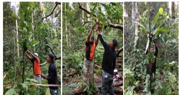
Gambar 6. Pemasangan / Peletakan Asplenium nidus pada tumbuhan sebagai inang di sekitar pohon bermain Paradisaea minor jobiensis

Rekayasa habitat sebagai bentuk upaya konservasi dalam kegiatan PKM sebagai implementasi kegiatan penelitian yang dilakukan oleh Raunsay (2014), dimana pada kajian tersebut menemukan Asplenium nidus sebagai tempat meletakkan sarang bagi Paradisaea minor jobiensis . Atas dasar penelitian ini maka bentuk implementasi dan kegiatan lapangan yang dilakukan pada kegiatan PKM memberikan gambaran kepada kita akan pentingnya merekayasa habitat sarang agar keberlangsungan satwa ini tetap lestari di dalam habitatnya, materi yang diberikan dalam kegiatan PKM dengan satu tujuan yaitu konservasi Cenderawasih sebagai sumber daya alam yang mereka miliki.